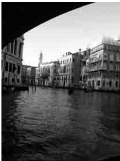
Venezia vista dal traghetto

Venezia, la città senza peso. Arrivando per mare la vediamo apparire in lontananza, come fosse un'immagine di vapore e acqua. Scorre lungo i canali, attraversa i ponti e le piazze. Si perde in labirinti di luce e giardini segreti. Dentro il riflesso di finestre antiche, impenetrabili. Il sogno. Questa è la sostanza di cui sono fatte le sue pietre e i suoi palazzi. Le sue invisibili fondamenta. Figlia del mare e del vento che viene da oriente, Venezia è una delle città più belle e cantate da poeti e scrittori di tutto il mondo. Ed è, quindi, anche il luogo ideale dove aprire un discorso sull'arte e sulla bellezza.