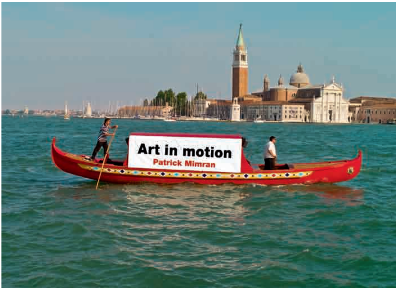
Art in motion, Arte in movimento, Venezia, foto in Diasec su Dibond in alluminio, 2010