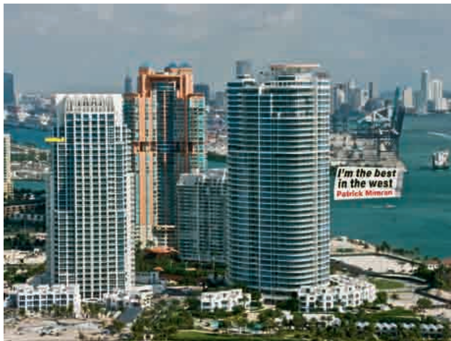
I'm the best in the west, (Sono il migliore in occidente), Tokyo, foto in Diasec su Dibond in alluminio, 2010 © Galerie Dorothea van der Koelen

Se una lettura di insieme alle varie frasi dei Billboards risulta interessante e divertente, non va, però, dimenticato che ognuna di queste affermazioni funziona in quanto installazione, è un Billboard . L'idea è e deve essere vista in relazione al contesto in cui compare.