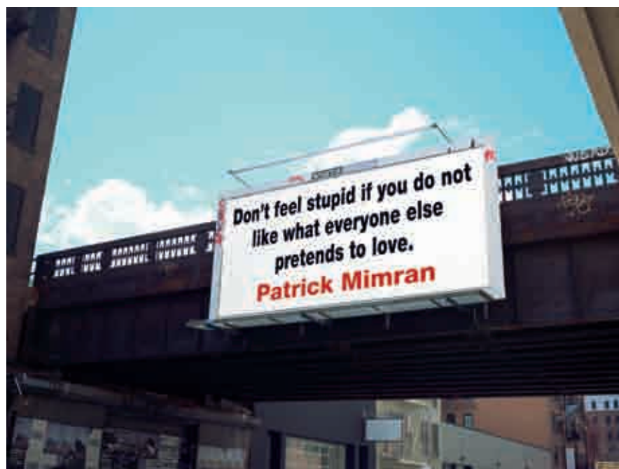
Don't feel stupid if you do not like what everyone else pretends to love (Non sentirti stupido se non ti piace quello che gli altri fingono di adorare), New York foto in Diasec su Dibond in alluminio, 2010