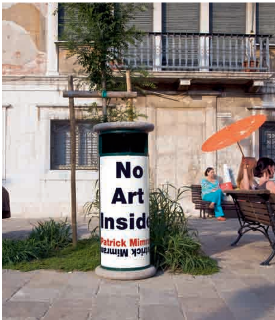
No art inside (Qui dentro niente Arte), Venezia, foto in Diasec su Dibond in alluminio, 2010