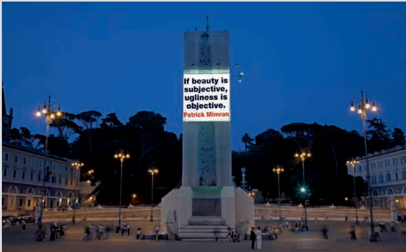
If beauty is subjective, ugliness is objective (Se il bello è soggettivo, il brutto è oggettivo), Roma, foto in Diasec su Dibond in alluminio, 2010

altri progetti. Qualcosa di anacronistico. Sto pensando di esporre Billboards in luoghi completamente spostati, forse nel deserto. Devo vedere di sviluppare questa idea. Non è una cosa facile. Ci vuole molto tempo per trovare il luogo giusto.