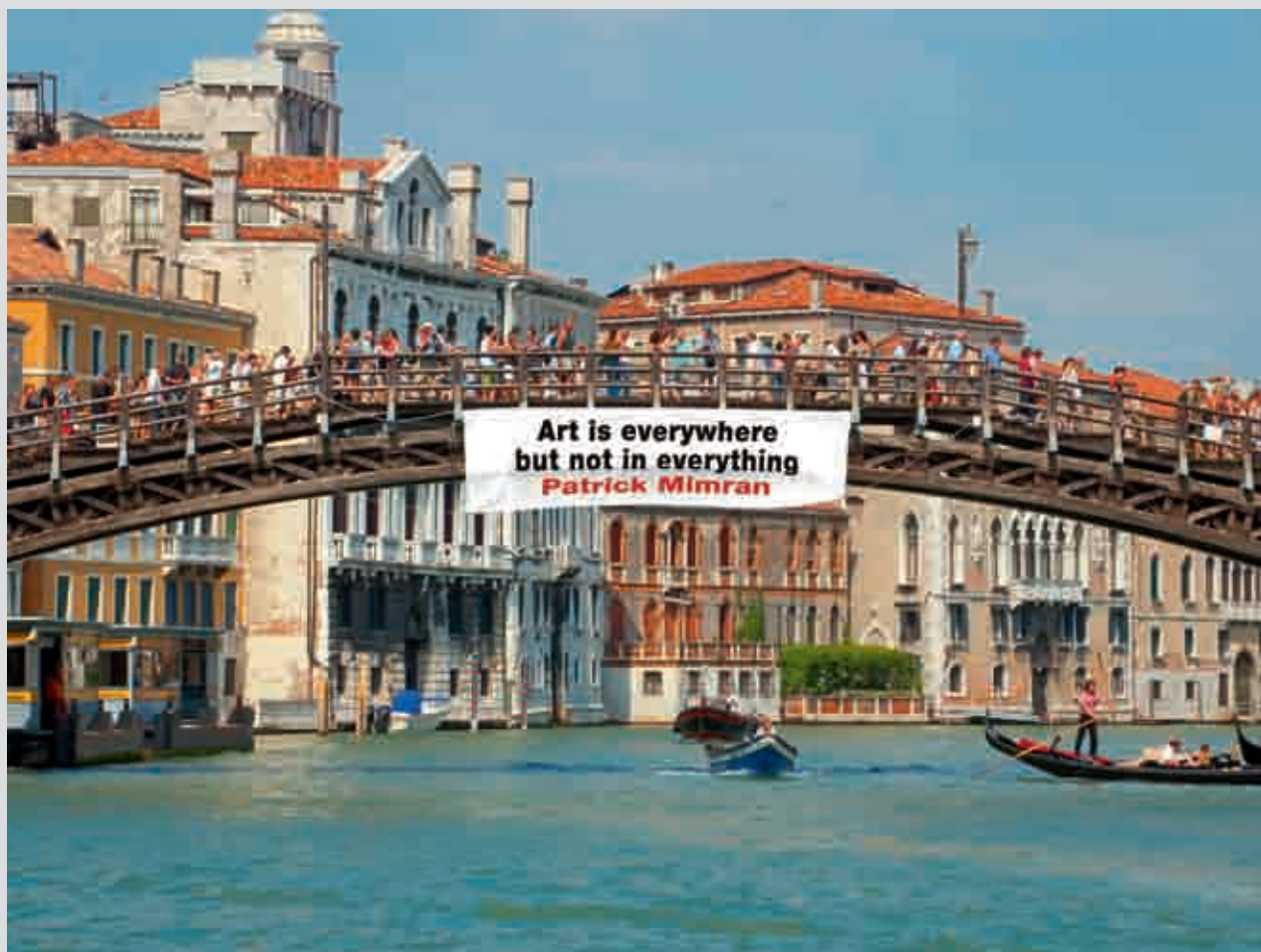
Art is everywhere but not in everything (L’Arte è dappertutto ma non in ogni cosa), Venezia, foto in Diasec su Dibond in alluminio, 2010

DvdK: In autunno farò una mostra di questi ed altri lavori fotografici a Mainz. Forse ci sarà anche un’installazione pubblica. Vedremo!