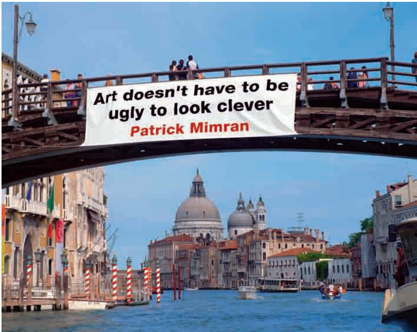
Art doesn't have to be ugly to look clever (L'arte non ha bisogno di essere brutta per sembrare intelligente), Venezia foto in Diasec su Dibond in alluminio, 2010

con un pensiero sull'arte, quindi, anche in un momento in cui non se l'aspetta. Immaginatoci di attraversare le strade di un centro storico, presi dai nostri impegni quotidiani. Ci spostiamo pensando già al luogo dove dobbiamo andare, a quello che dobbiamo fare. Quando una scritta si impone al nostro sguardo. Ma non si tratta di una pubblicità. Sembra quasi un avvertimento rivolto proprio a noi: "L'arte non è dove pensi di trovarla". Questa affermazione, apparentemente semplice e diretta, inizia a frullarci in testa mentre ci allontaniamo. Solo poco a poco cominciamo a mettere a fuoco alcuni particolari. Il Billboard "Art is not where you think you are going to find it" è affisso sulla facciata del Museo d'arte Moderna Ca' Pesaro di Venezia. Nel paesaggio urbano, quindi, ma non in un posto qualsiasi. Inevitabile un confronto con il contesto. Una provoca-