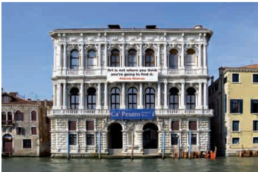
Art is not where you think you're going to find it (L'Arte non è dove pensi di trovarla), Venezia, foto in Diasec su Dibond in alluminio, 2010

in modo chiaro, lineare. È una pausa che si inserisce nel ritmo frenetico della città. Il nero è lapidario e sintetico. Il rosso, invece, mette in risalto, con eleganza quasi regale, il nome dell'autore. Mimran utilizza gli strumenti della pubblicità, ma va oltre. Alla coerenza della forma corrisponde una coerenza di contenuti, o, meglio, di idee. "Sono pensieri che pongono domande, senza dare, in fondo, una risposta. Questo è l'aspetto avvincente." – ci ha detto Dorothea van der Koelen - "L'arte non deve dare risposte, deve porre domande, secondo me. Se l'arte dà risposte, allora è finita. Si può ricevere la palla che Mimran lancia e rilanciarla." Le frasi, o idee, dei Billboards in effetti sono affermazioni, all'apparenza anche piuttosto decise. Ma la gallerista ha ragione: pongono domande. La domanda è il risultato dell'interazione fra l'ambiente, dove il Billboard è installato, l'idea che esprime e l'osservatore. C'è subito una questione interessante da individuare: chi è l'osservatore in questo caso? Quando si parla di arte l'osservatore, normalmente, è un visitatore. Qualcuno, comunque, che si aspetta un confronto con l'arte. Nel nostro caso questa relazione è leggermente spostata. "La gente passeggia in una piazza o una strada. Invece di vedere la coca cola o altro, vede una frase in bianco e nero sull'arte." – racconta Mimran – "È sorprendente. Questo provoca delle risposte e delle reazioni che sono più spontanee." Ognuno ha la possibilità di confrontarsi