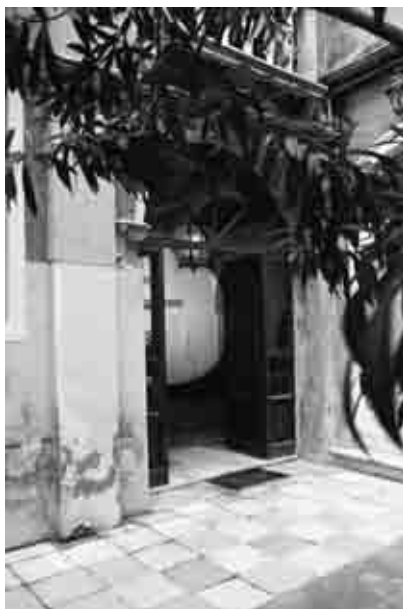
Il cortile de La Galleria, Venezia

Lo sfondo del Billboard è sempre rigorosamente bianco. La scritta è in nero. La firma in rosso. Mimran utilizza sempre lo stesso carattere. Questi dettagli, che rendono il suo lavoro riconoscibile ovunque, hanno anche una valenza estetica. Il bianco costruisce uno spazio aperto, luminoso, dentro il quale il pensiero può essere espresso